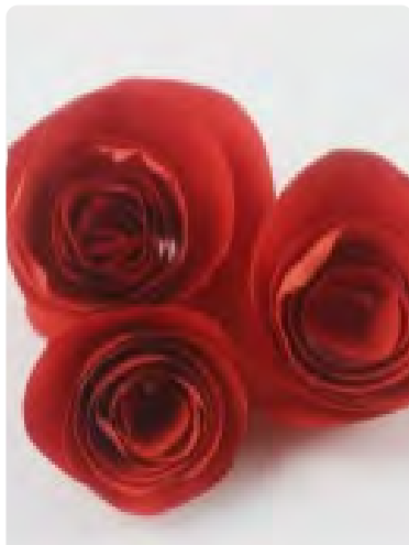
Hacer rosas de papel

Papás: este año puedes olvidar las flores, ¡pero no olvides el Día de la Madre! Hemos incluido algunas cosas solo para padres para que usted y los niños puedan hacer de este un día especial sin tener que ir a la tienda.