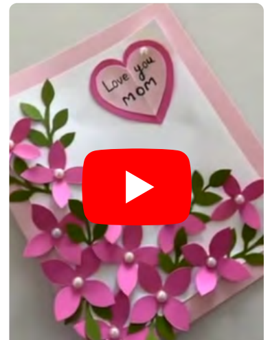
Ideas de bricolaje

¡Hay un 50% de probabilidad de lluvia el domingo!