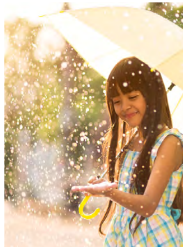
Plan de picnic interior